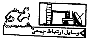
تصویرسازی کتاب کودکان

تا کنون نیز چندین مورد قتل و خودکشی در میان ایرانیان شاغل در ژاپن روی داده است که از آن جمله چندی قبل یک تن از ایرانیان پس از آغشته کردن بدن خود به بنزین اقدام به خودسوزی کرد و فرد دیگری سه روز قبل از پشت سر مورد حمله قرار گرفت و به قتل رسید.