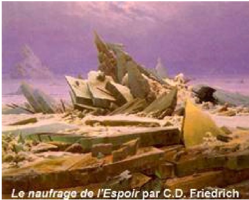
Le naufrage de l'Espoir par C.D. Friedrich